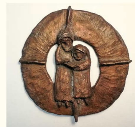
La médaille Frère Nicolas et Dorothee du KLB Bavière

Le mouvement catholique paysan de Bavière (KLB) honore tous les ans depuis 1987 des personnes et communautés qui se sont engagés de manière particulière en l'honneur de Frère Nicolas, son patron. En signe que Dorothee est indissociable de Nicolas, le Comité a demandé à Martin Landinger en 2007 de concevoir une nouvelle médaille représentant le couple. Cette nouvelle plaquette de 16 cm «Frère Nicolas et Dorothee» est décernée depuis lors.