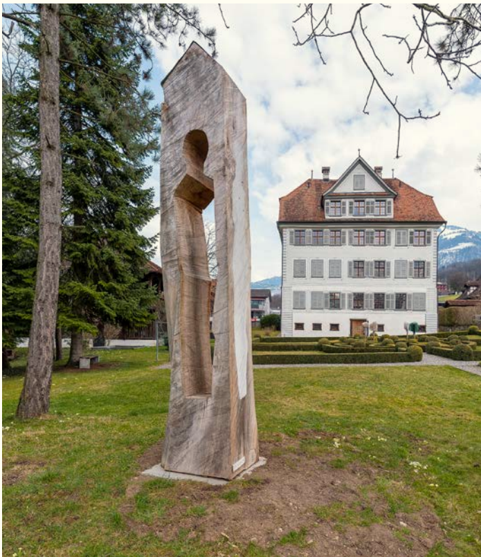
Frère Nicolas et Dorothee, sculpture dans le jardin du musée Frère Nicolas Sachseln