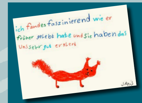
Réaction d'une élève

À côté des visites guidées pour adultes, près de 50 classes et groupes de premiers communiant ont profité en 2018 du parcours interactif «Sur la route avec Nicolas de Flüe» et se sont plongés, sous conduite compétente, dans le monde de Frère Nicolas et de sa famille.