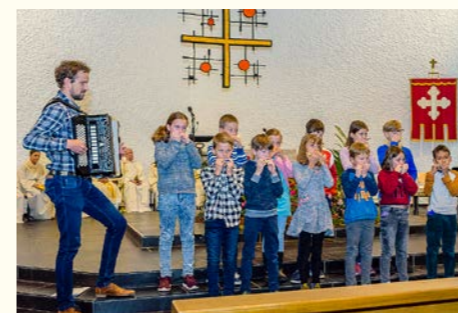
On fête Frère Nicolas à Büren NW