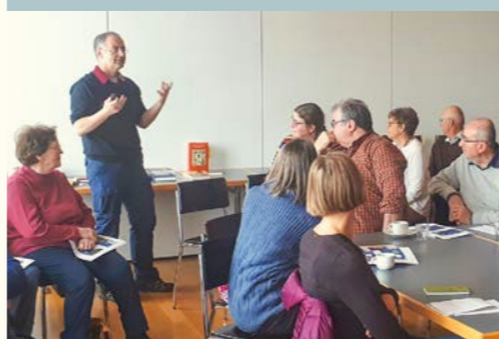
Formation continue pour les guides