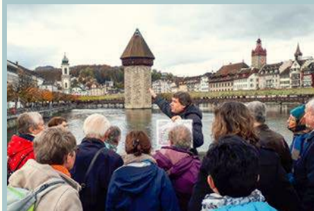
Sulle tracce di Nicolao della Flüe nella città di Lucerna

Sia per i più preparati che per i novellini, sia per le scolaresche che per gli adulti, le nostre guide esperte hanno sempre tante storie avvincenti e istruttive. Oltre alle visite guidate a Flüeli, nella chiesa parrocchiale, presso il sepolcro e al Museo Bruder Klaus di Sachseln, vengono organizzate anche delle escursioni a Stans, luogo in cui venne accordata la pace nel 1481, e da poco anche a Lucerna.