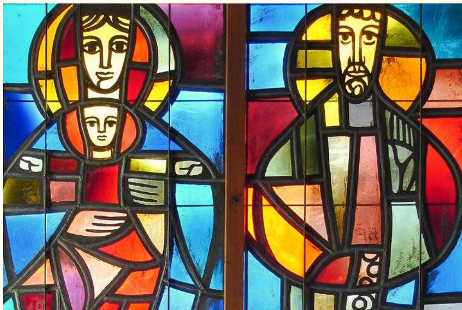
Dorotea e San Nicolao, dettaglio della vetrata della chiesa di San Nicolao a Grindelwald