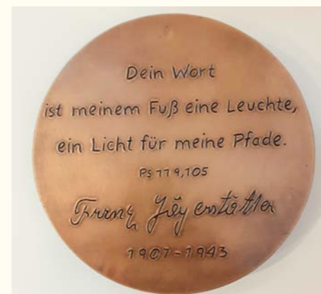
Plaque d'autel, chapelle Maria Alm, réalisée par un petit-fils de Franz Jägerstätter : Ta parole est une lampe sur mes pas, une lumière sur ma route. (Ps 119,105).

Désormais la chapelle œcuménique de la paix « Frère Nicolas et Dorothee » à Maria Alm (Autriche) devient aussi un mémorial Jägerstätter. Le 25 septembre 2020, une relique de Franz Jägerstätter sera déposée dans l'autel en bois de la chapelle, auprès de celle de Frère Ni-