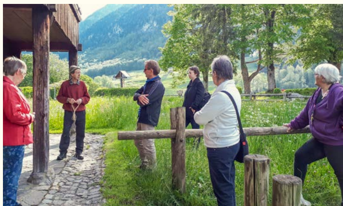
Initiation des nouveaux responsables de maisons.

Le 11 mai, enfin la réouverture des maisons natale et d'habitation. La saison a débuté avec plus de 5 semaines de retard à cause du corona. Les responsables des maisons, aussi les nouveaux, ont dû patienter pour leur 1ère intervention en 2020.