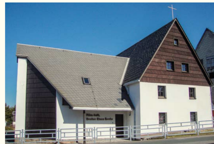
Église Frère Nicolas Zinnwald Construction : 1963/64 Consécration : 22 août 1964 par Mgr Otto Spülbeck

Après la guerre de nombreux catholiques s'installèrent dans cette région. Ils venaient principalement des Sudètes d'où ils avaient été expulsés. Il s'agissait pour eux de trouver une nouvelle patrie spirituelle. Les premières messes catholiques eurent lieu dans une école. Plus tard ils bénéficièrent de l'hospitalité de l'église évangélique. Cependant, le désir d'avoir leur propre église se fit jour rapidement. Ils offrirent d'acheter plusieurs bâtiments à la commune mais le projet échoua à chaque fois en raison de la résistance des autorités de la RDA. Pour des raisons inconnues, celles-ci ne voulaient pas d'une église catholique précisément à la frontière tchèque. Après de longues tergiversations, la communauté catholique reçut enfin en avril 1963 l'autorisation d'acheter une maison non terminée au milieu du village pour l'aménager en église. Ceci à une condition : que le bâtiment ne soit pas reconnaissable en tant qu'église, mais « camouflée » comme une quelconque maison d'habitation. Les autorités politiques étaient satisfaites de se débarrasser ainsi d'une « tache » structurelle au milieu du village. Soutenue par des