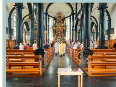
Messe du pèlerinage du district d'Einsiedeln le 1er juillet 2020 à Sachseln