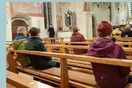
Prière pour la paix, paroisse Buochs, avec la distance corona

La « prière pour la paix » a été instituée en 1981, lors du 500ème anniversaire du Covenant de Stans. Depuis, dans les semaines avant le 22 décembre, en novembre, parfois en décembre,