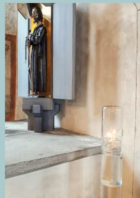
Lumière de la paix, chapelle inférieure

Depuis 35 ans la lumière pour la paix est rallumée en novembre dans la grotte de la Nativité et apportée en Europe en signe d'espoir et d'unité, en passant par Vienne et aussi au Ranft, ce lieu significatif d'espoir de paix. L'arrivée de la lumière de la paix de Bethléem a été célébrée simplement le 3ème dimanche de l'Avent 2020. Désormais, elle brille toute l'année dans la chapelle inférieure du Ranft , dans une lampe à huile en verre fa-