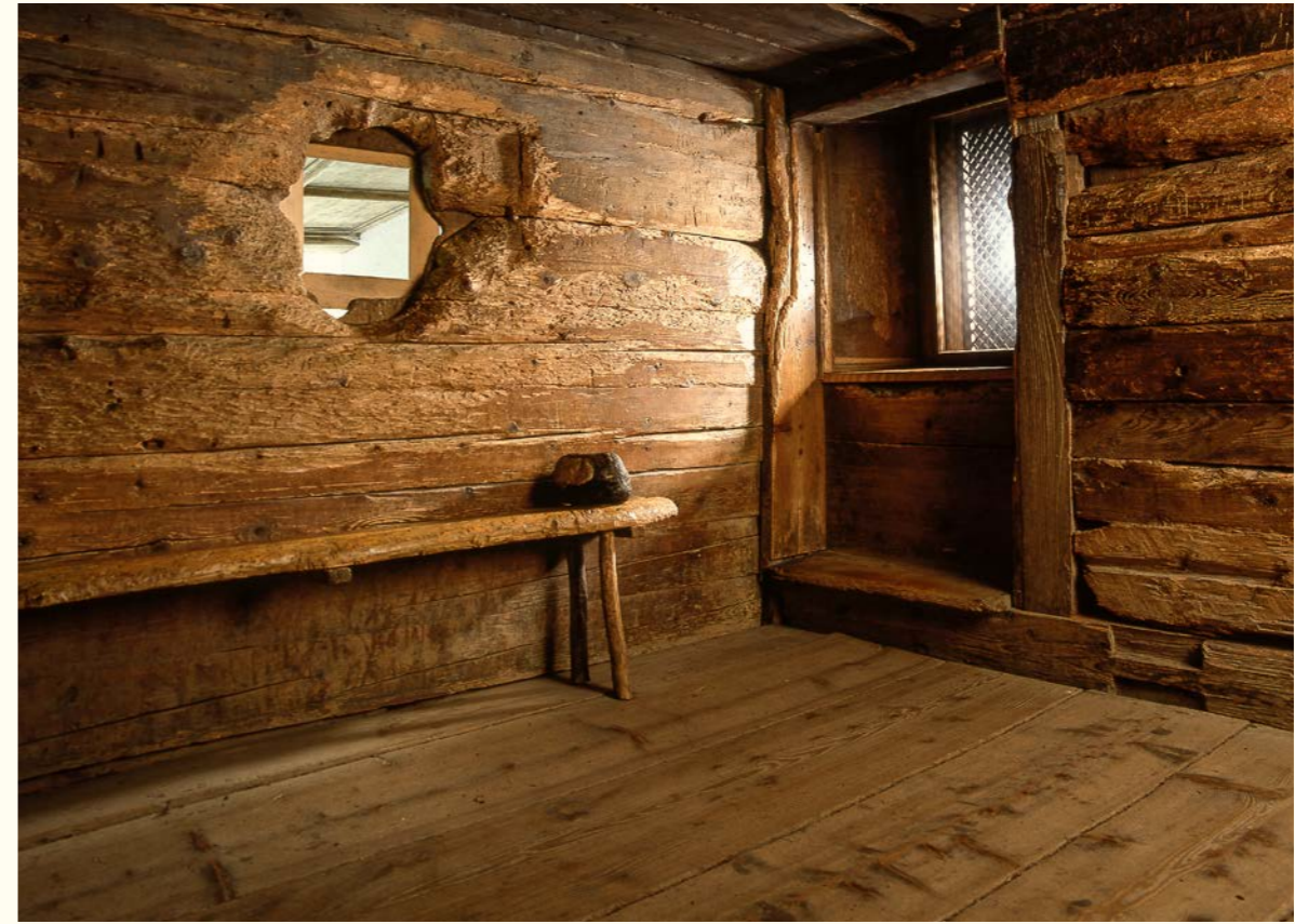
Cellule de Frère Nicolas : Une fenêtre donne vers l'intérieur sur l'autel, l'autre vers l'extérieur, vers les gens.

Écouter est en soi déjà assez difficile car il faut se retenir pour ne pas créer trop vite des solutions et engendrer ainsi une paix superficielle. C'est encore tôt. Si nous sommes sortis de notre zone de confort en écoutant et en prenant au sérieux notre interlocuteur, et si nous avons supporté le point de vue des autres, il s'agit désormais d'éclaircir les faits, d'exposer les intérêts, d'analyser les gagnants et les perdants et donc les structures de pouvoir. Cela aidera à relier les perceptions à des bases solides et à les situer dans la réalité de notre monde. Pour que le travail de paix réussisse, il faut aussi clarifier les repères et donc les valeurs qui guident notre action